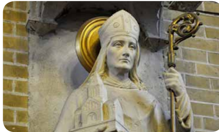
Dit beeld van de H. Willibrord is gemaakt door beeldhouwer J. Maas. Het werd in 1905 geschonken door trouwe parochianen ter gelegenheid van hun zilveren huwelijksfeest.

Het was de missionaris Willibrord uit Ierland die omstreeks 690 aan de monding van de Rijn in Nederland voet aan wal zette. Achter de beschutting van de duinen stichtte hij toen één van zijn eerste kerkjes. Dit oude kerkje werd verwoest tijdens het Leids Ontzet in 1572.