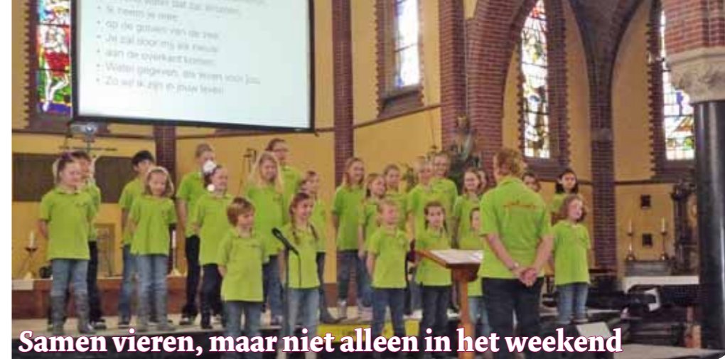
Samen vieren, maar niet alleen in het weekend

In 2007 is het historisch archief van de parochie bij de gemeente Katwijk ondergebracht om het beter te bewaren voor het nageslacht, maar niet na vele publicaties in het parochieblad Het Schip en lokale bladen. Vele wetenswaardigheden en prachtige verhalen zijn zo 'Van stof ontdaan'. Op de pastoriezolder lag alles onbeschermd en door vele uren vrijwilligerswerk is alles nu goed gearchieveerd. Een aanrader voor wie dit nog niet heeft gedaan, want je komt zoveel meer te weten over vroegere jaren.