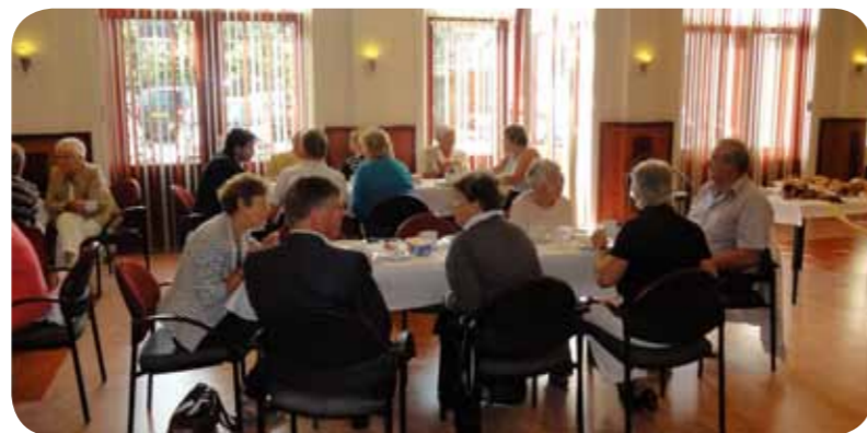
Gezamenlijk ontbijt in 'de kleine JOANNES' voor de viering en de fietstocht op St. Jansdag.

Vooraf door de vestiging van de paters jezuiteten in 1831 aan het Overrijn, kwam de nieuwe parochie nu wel met medewerking van de geestelijke en wereldlijke overheid tot stand. De Kolfsbaan en de stal van het logement 'De Palmboom' in de Grote Steeg werden gesloopt en van het materiaal werd een nieuwe parochiekerk gebouwd. De herberg zelf werd pastorie en bleef dat tot 1911. Het kerkje telde 254 zit- en staanplaatsen. Het was maar heel eenvoudig, maar in 1846 werd dit kerkje dan plechtig ingewijd. Het gouvernement erkende de parochie als een zelfstandige gemeente en het parochieleven kwam op gang. Een tekort aan plaatsen in de kerk, vooral tijdens het badseizoen,