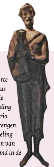
Samen vieren in de Sint Jozef.

Jozef (bijgenaamd de timmerman) was volgens de Bijbel de pleegvader van Jezus Christus. Hij was ten tijde van Jezus' geboorte met Maria verloofd. Jozef wordt in Mattheus genoemd als zoon van een verder onbekende Jakob. In het boek Lucas 1:26-38 wordt melding gemaakt dat de aartsengel Gabriël aan Maria berichtte dat zij een zoon ter wereld ging brengen. De Bijbel vertelt ook dat Jozef een afstammeling was van koning David. Hij was timmerman van beroep. De laatste keer dat hij wordt genoemd in de Bijbel is als Jezus twaalf jaar oud is.