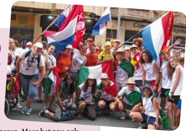
Enthousiast samen kerk zijn en beleven.

Als jullie, jongeren, een super geloofsfeest in Brazilië willen meebeleven, dan nodig ik jullie uit om alvast te sparen. Maar het zou ook mooi zijn als jullie opa's en oma's en ouders jullie willen sponsoren. Een deelname aan de Wereldjongerendagen verandert jullie leven, dat bleek ook na het feest in Madrid. Jongeren hebben God kunnen ervaren in andere jongeren, in de stilte, tijdens vieringen en in hun eigen harten. Dat gunnen we elkaar toch?