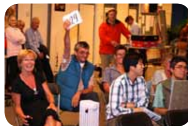
Kerkenveiling voor het kerkdak.

Het leien dak van deze kerk was na meer dan honderd dienstjaren aan vernieuwing toe. Voor deze restauratie was veel geld benodigd, ongeveer 500.000 euro. In 2007 en 2008 is een deel van dit bedrag verkregen door allerlei acties, giften, sponsoring en subsidies. Elke euro die op deze manier werd ontvangen, is door het parochiebestuur verdubbeld. Er is in totaal ruim 170.000 euro opgehaald. Tal van activiteiten zijn door parochianen georganiseerd. Zo zijn er workshops gehouden, zijn er kaarsen en wijn verkocht, auto's gewas-