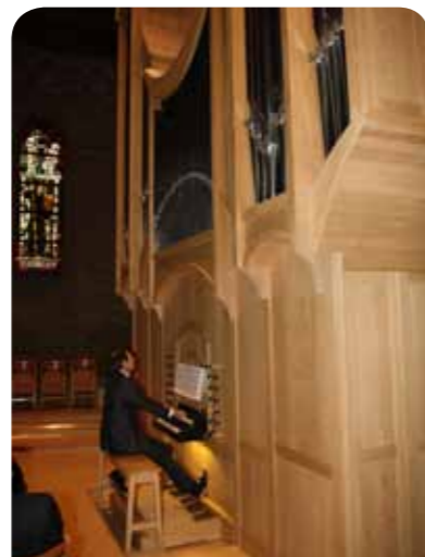
Enthousiaste toehoorders en een bezige organist bij de feestelijke ingebruikneming van het Elbertse - orgel op 9 april 2011.

Een hartelijke oecumenische samenwerking van parochianen van De Goede Herder met de gemeenteleden van de nabijgelegen Kievietkerk (P.K.N.) bestaat sinds vele jaren. Gezamenlijke vespervieringen, avondmuziek bijeenkomsten en een meditatieve duinwandeling zijn gehouden. Daarnaast is al zeven keer een gezamenlijk adventboekje uitgegeven.